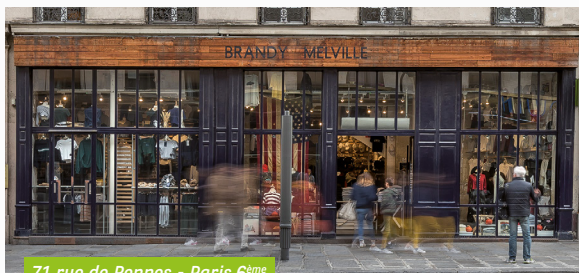
71 rue de Rennes - Paris 6 ème

Votre SCPI a signé le 2 août 2019 une promesse d'achat qui lui donne l'opportunité de reconstituer la pleine propriété de la boutique louée à l'enseigne Brandy Melville , située rue de Rennes à Paris 6 ème , dont la première partie est détenue par la SCPI depuis 2012. L'actif bénéficie d'une localisation centrale et d'une très bonne visibilité. Cette opération contribue à la stratégie de la SCPI qui vise en priorité des boutiques situées dans les centres-villes de grandes agglomérations. La signature de l'acte authentique est prévue courant du quatrième trimestre 2019 pour un montant de 2,7 M€ acte en main.